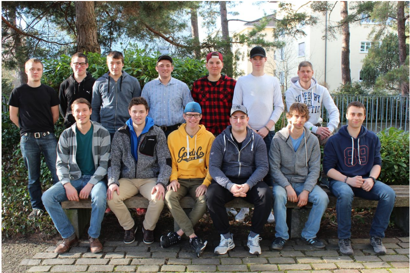
Forstwartklasse FO 14 a