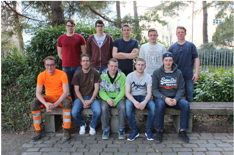
Forstwartklasse FO 14 b