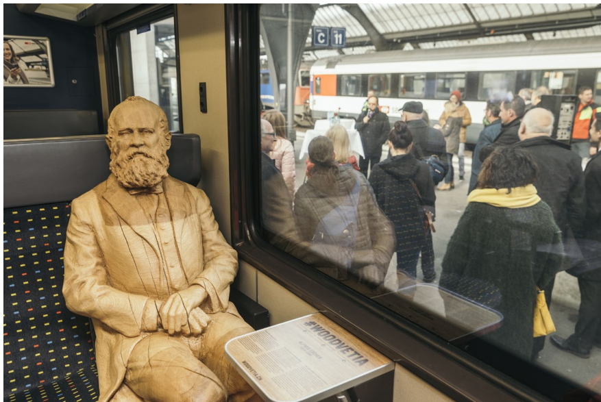
Alfred Escher (1819-1882) aus Zürcher Stieleiche