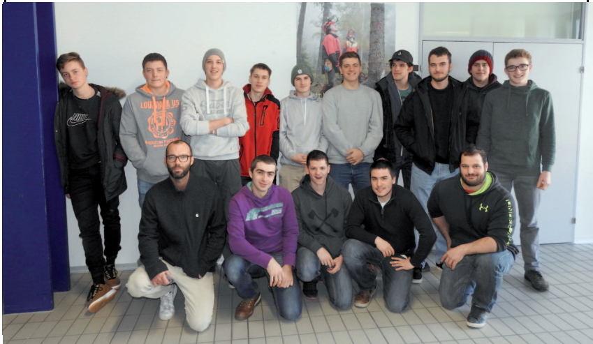
Forstwartklasse FO 15 a