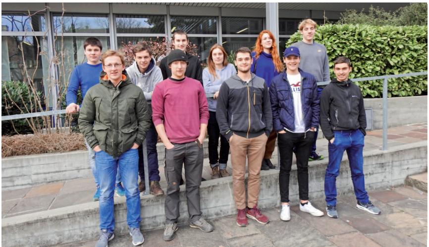
Forstwartklasse FO 15 b