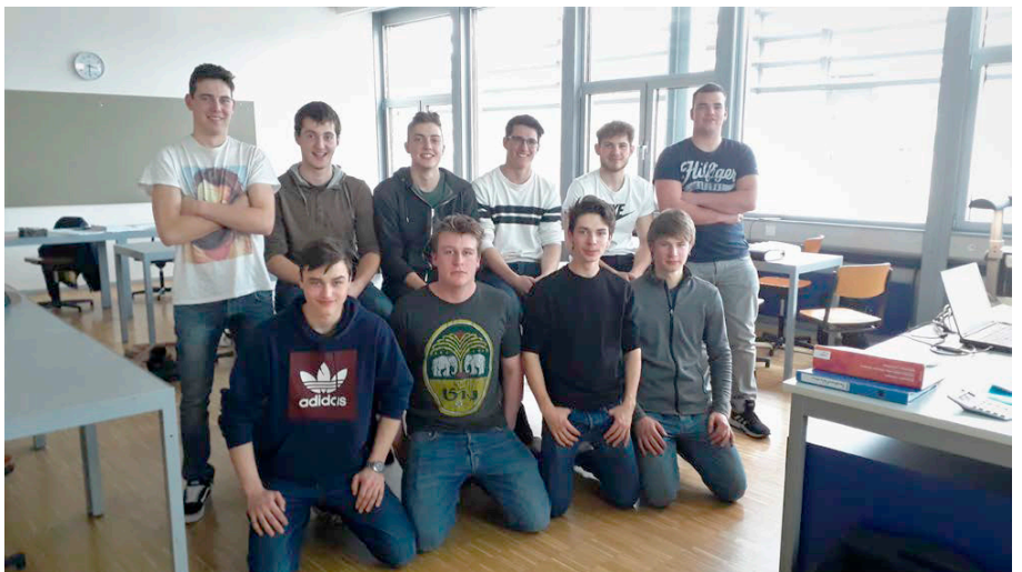
Forstwartklasse FO 17 b