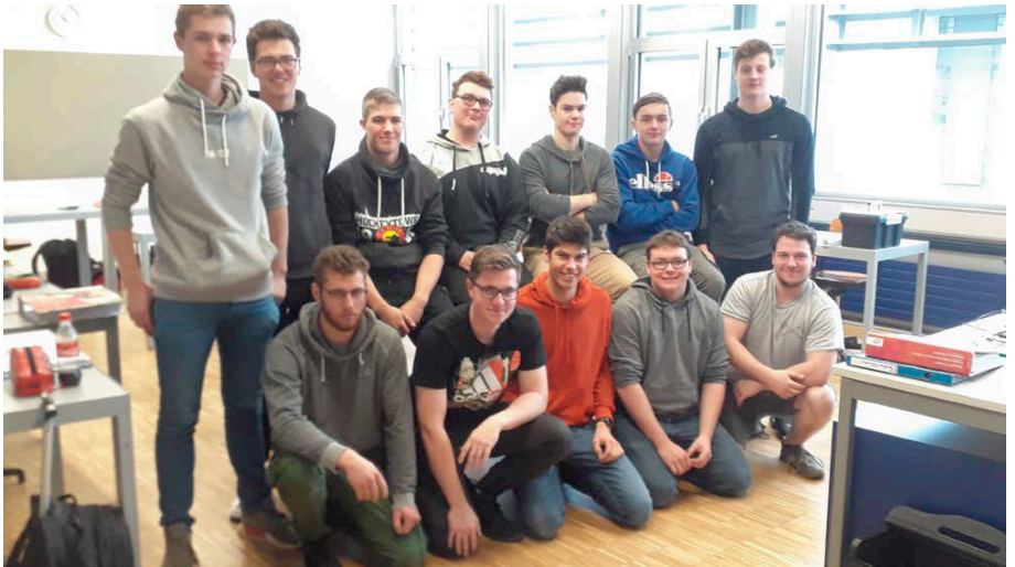
Forstwartklasse FO 17 a