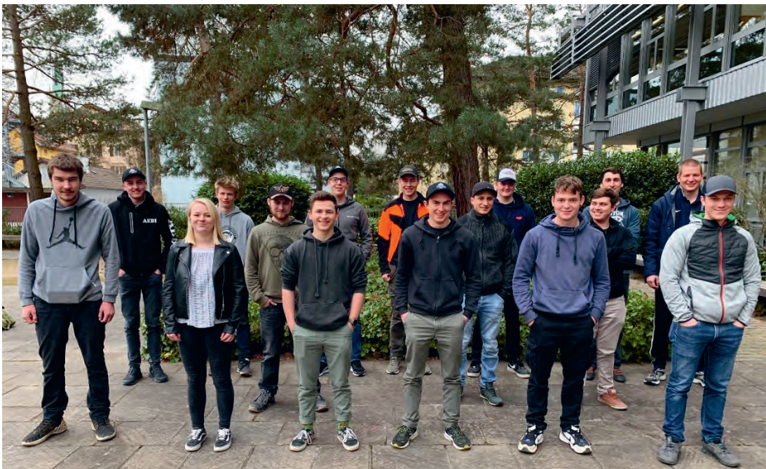
Forstwart/in-Klasse FO 18 b