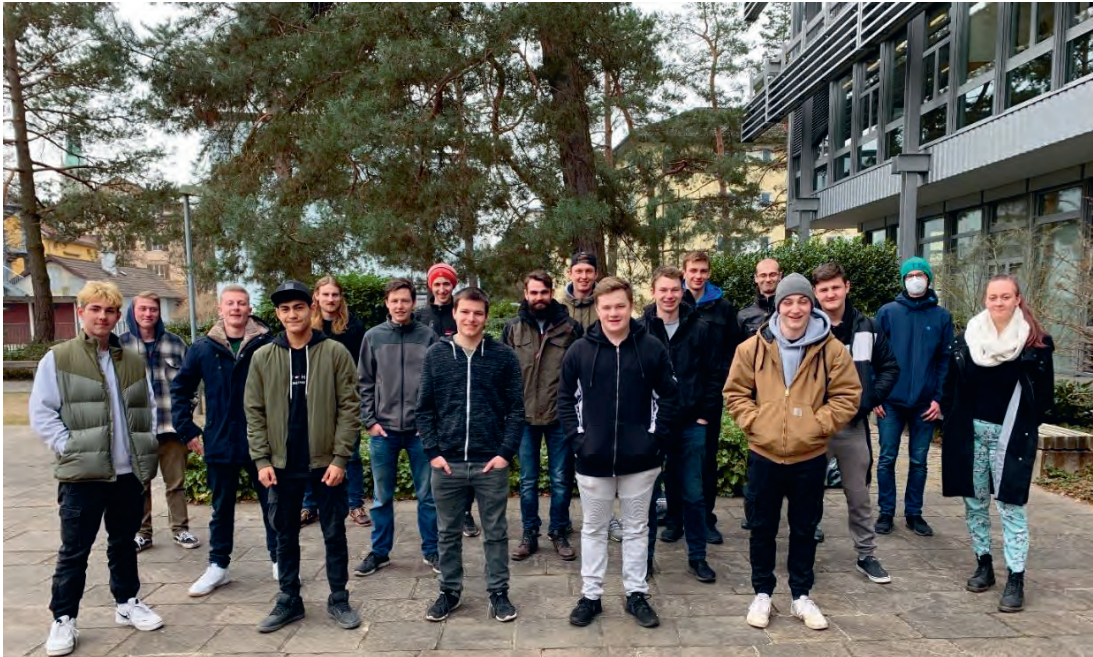
Forstwart/in-Klasse FO 18 a